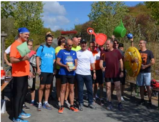
Die motivierten Teilnehmer 2018